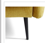
Chrom Nr. 617 Schwarz (matt) Nr. 665