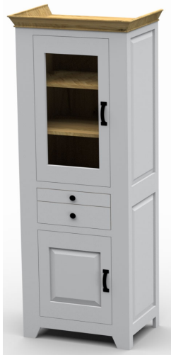
6864- / Vitrine mit Bestecklade, links angeschl.