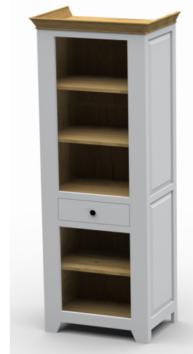
6894- / Regal, offen