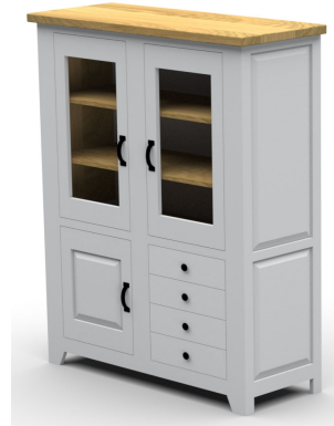
6854- / Highboard