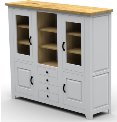
6844- / Highboard