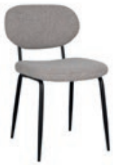
Beine: Pulverbeschichtet schwarz