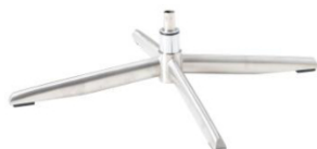
Fuß 71 4-Sternfuß Aluminium