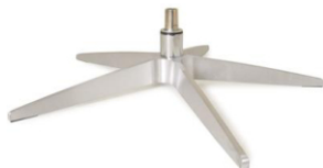
Fuß 31 5-Sternfuß Aluminium