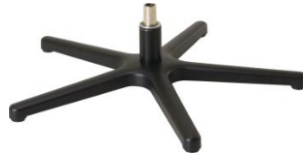
Fuß 84 5-Sternfuß schwarz