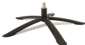
Fuß 88 5-Sternfuß Edelstahl schwarz Nicht geeignet für Twice Pro