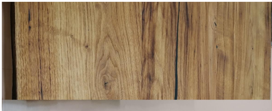
Tischstirnseite: bearbeitet, gerade

Achtung – Bei Bestellung unbedingt angeben.