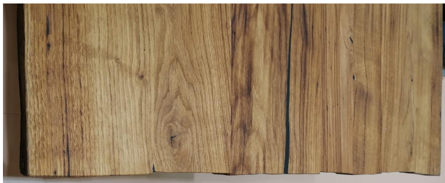
Tischstirnseite: unbearbeitet, unregelmäßig