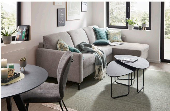
Global Melida – als Ecksofa