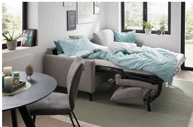
Global Melida – mit Schlaffunktion