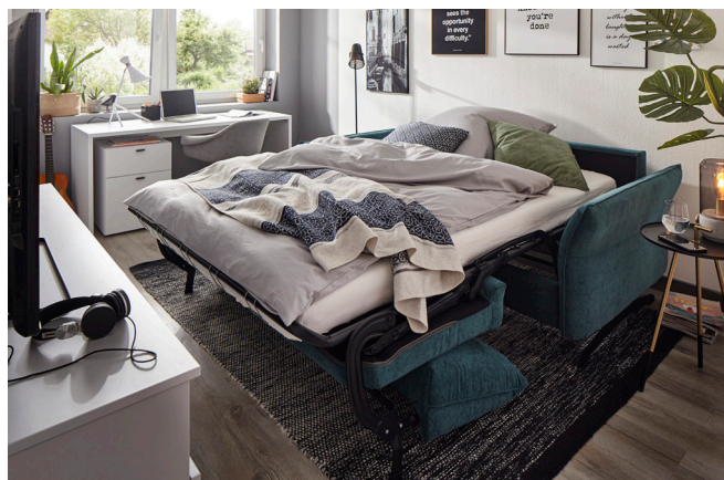
Global Melida– mit Schlaffunktion