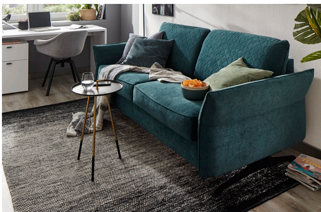
Global Melida – als Sofa 2-sitzig