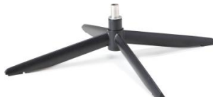
Fuß 72 4-Sternfuß schwarz