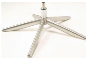
Fuß 41 5-Sternfuß Edelstahl