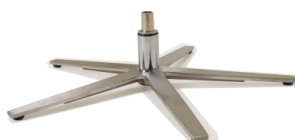
Fuß 86 5-Sternfuß Edelstahl