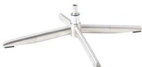
Fuß 71 4-Sternfuß Aluminium