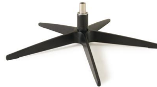
Fuß 32 5-Sternfuß schwarz