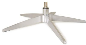
Fuß 31 5-Sternfuß Aluminium