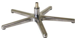
Fuß 83 5-Sternfuß Aluminium