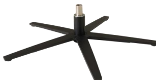
Fuß 87 5-Sternfuß Edelstahl schwarz

Achtung: Um den Fußboden vor Kratzer zu schützen, bitten wir Sie darauf zu achten, dass der jeweilige Fußboden geschützt wird durch gesondertes Unterlegen unter die Standardfußvarianten des Herstellers.