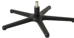
Fuß 84 5-Sternfuß schwarz