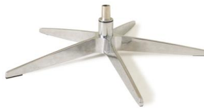
Fuß 33 5-Sternfuß Edelstahllook