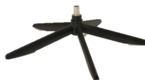
Fuß 42 5-Sternfuß Edelstahl schwarz