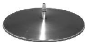
Fuß 27 Teller Edelstahl