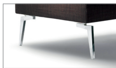
Optional ohne Aufpreis M058 Metallfuß Chrom glanz