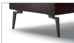
Optional ohne Aufpreis M058 Metallfuß Schwarz Nickel